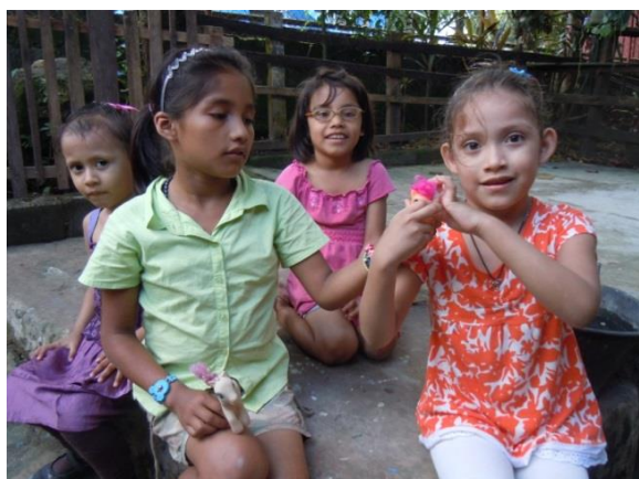
Kinder unseres Projekts in Bluefields

Der Nicaragua-Verein wurde im Juli 2003 gegründet und ist seit September 2003 vom Finanzamt Ettlingen als gemeinnützig anerkannt. Durch persönliche Begegnungen in Nicaragua entstanden, hat der Verein das Ziel, jungen Menschen aus sozial zerrütteten Familien ein Leben in geordneten Verhältnissen zu ermöglichen, vor allem schulische Bildung . Der Verein unterstützt die Hermanas Misioneras Franciscanas , eine kleine franziskanische Schwestern-Kommunität, die ein Kinderheim in Bluefields (Stadt an der Ostküste) unterhält. Seit 2002 haben schon einige Abiturientinnen des Gymnasiums ein FSJ oder Praktikum in diesem Kinderheim absolviert. Ohne die finanzielle Unterstützung durch den Verein könnte das Kinderheim nicht existieren.